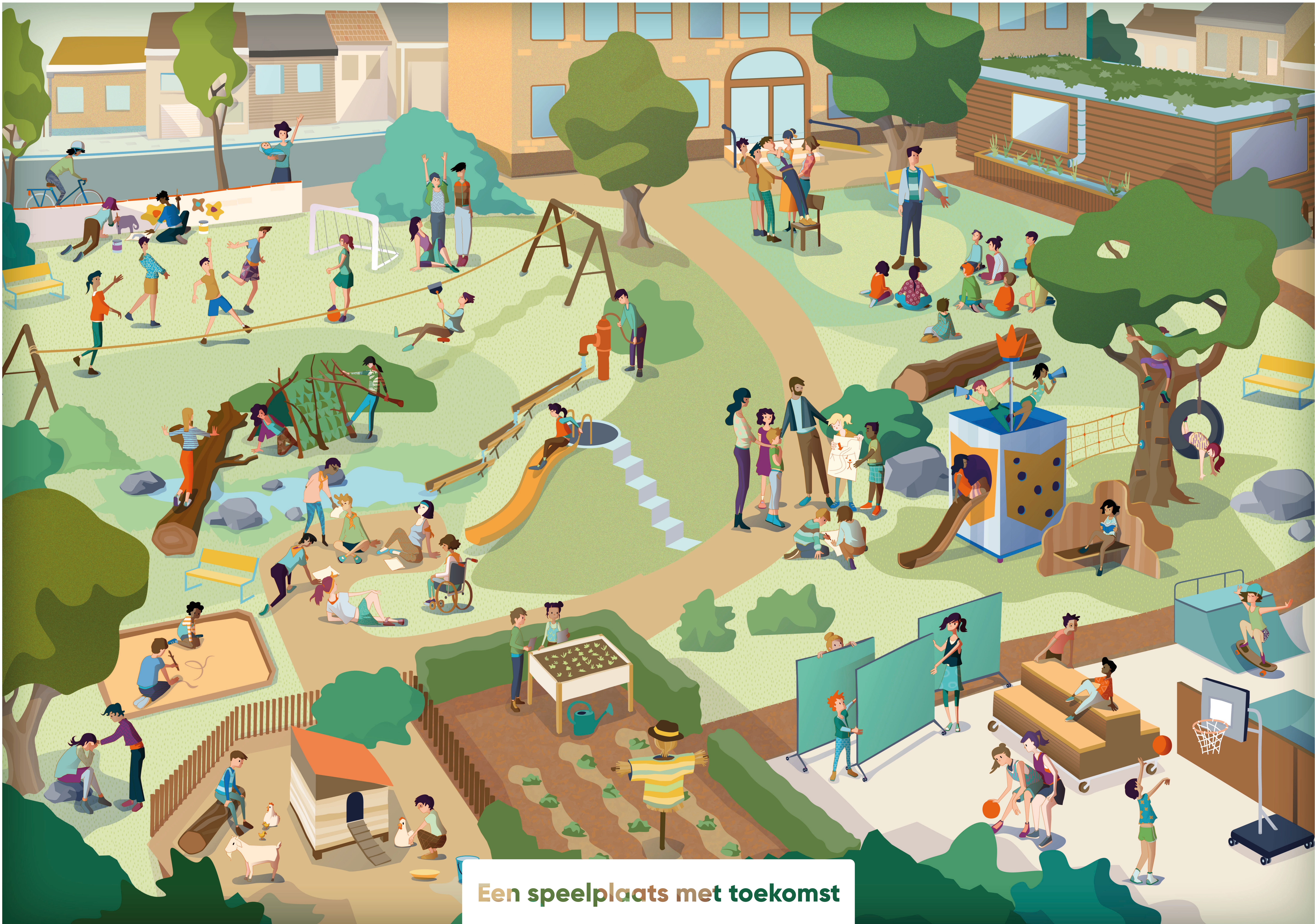
Een speelplaats met toekomst