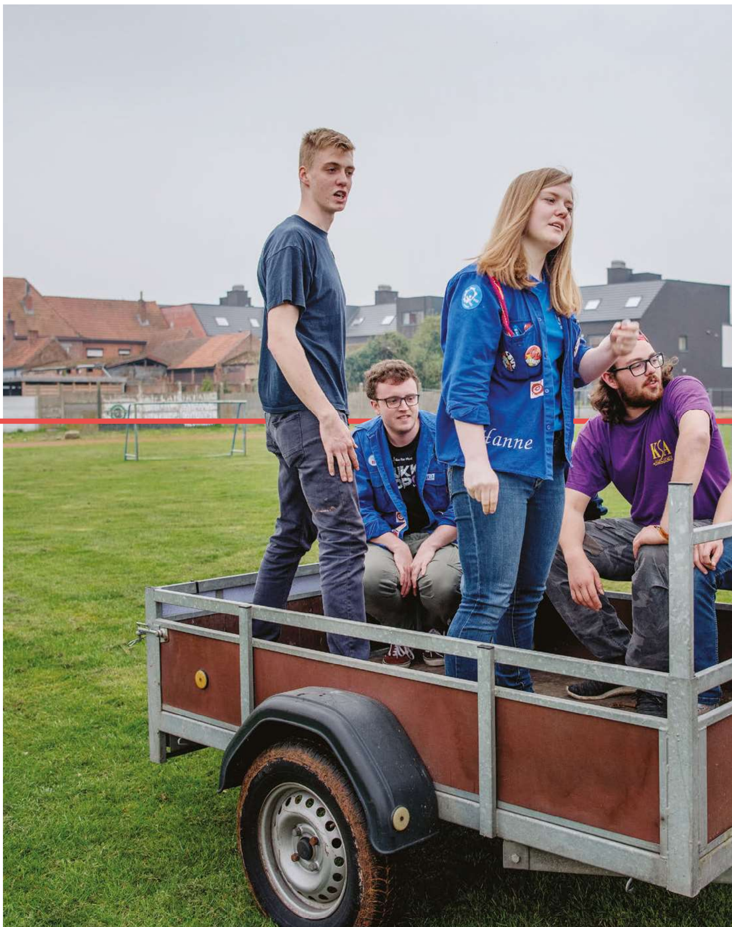
↑ Vrijwilligers van KSA Limburg doen alle voorbereidingen voor het slotevenement Trip Trap, een vierdaagse fietstocht voor 16+ers en leiding.